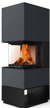
Mel 55 Beton anthrazit