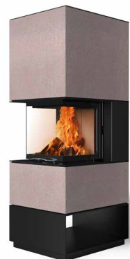
Mel 55 Beton terra