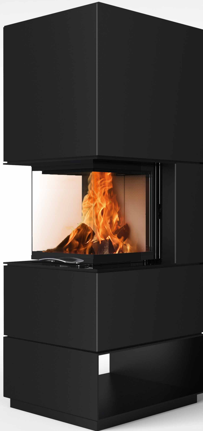
Mel 55 Stahl