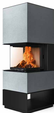
Mel 55 Beton hell