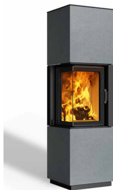
Minh 38 Beton hell