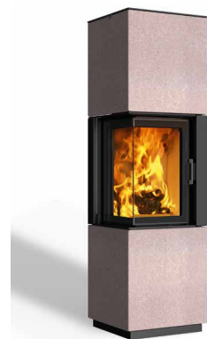
Minh 38 Beton terra