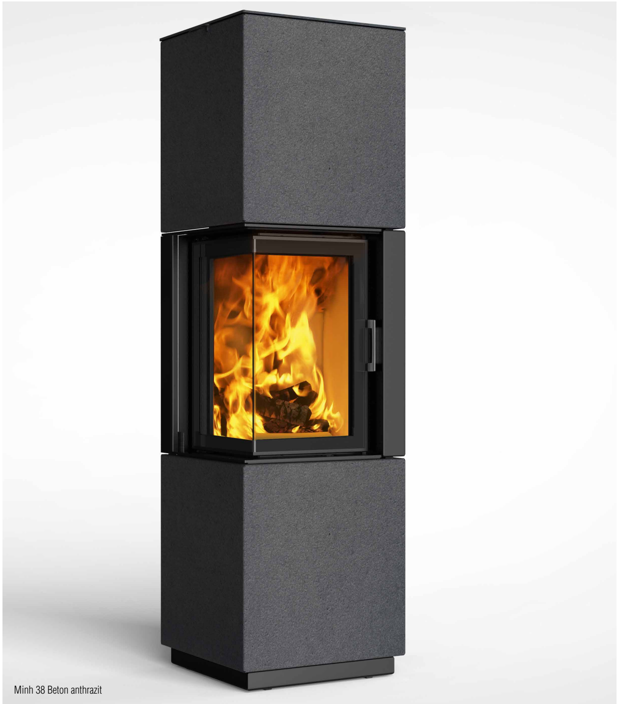
Minh 38 Beton anthrazit