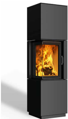
Minh 38 Stahl