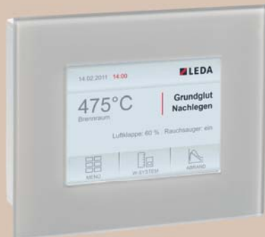
LEDATRONIC Touchscreen-Display, weiss